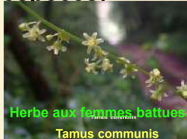
Herbe aux femmes battues Tamus communis