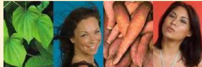
Dioscorea villosa = igname sauvage