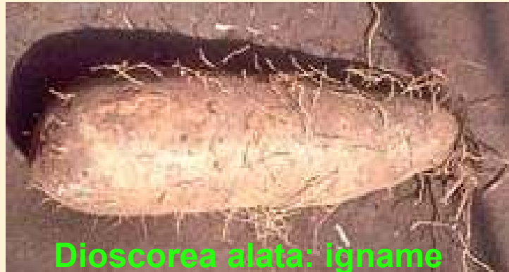
Dioscorea alata: igname alimentaires