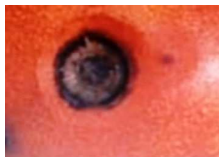
Anthraxose sur tomate