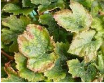
Carence en potasse sur vigne