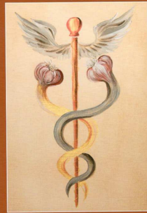
Illustration: Simon Sappier - www.simon-sappier.com

Bertrand Menut, un des plus gros courtiers d'ail d'Europe, se revendiquant à raison comme botaniste et agro-herboriste, nous propose cet ouvrage majeur sur l'Allium Thérapie