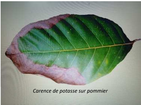
Carence de potasse sur pommier