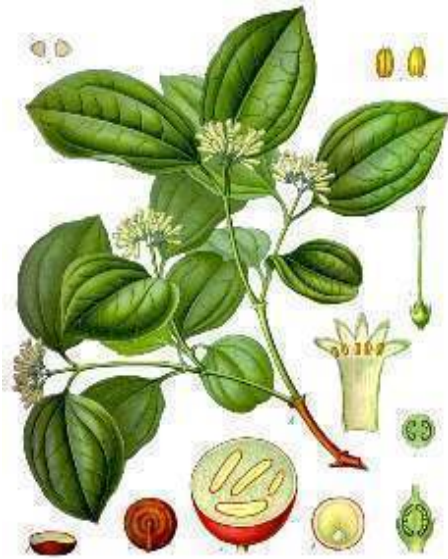
Strychnos nux-vomica L.