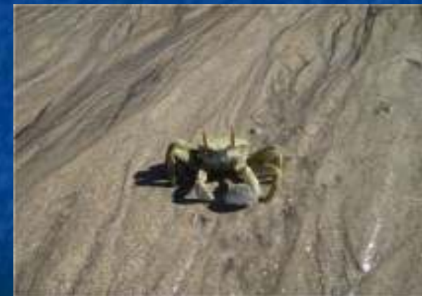
Fuyant comme le sable