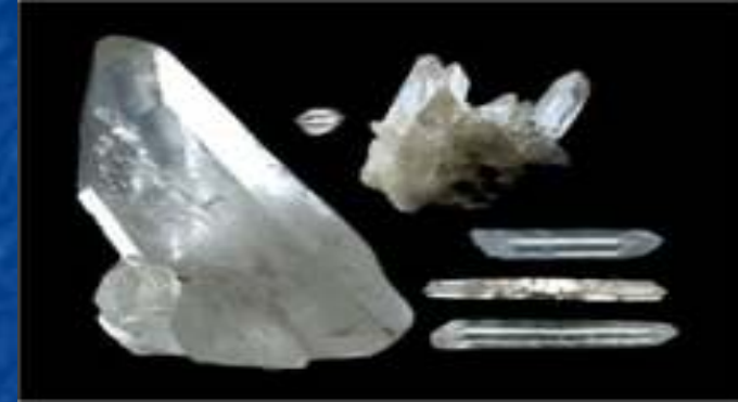
Dur comme le quartz