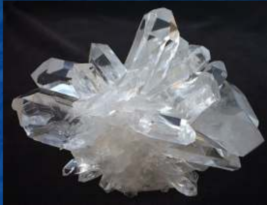
Crisal de roche